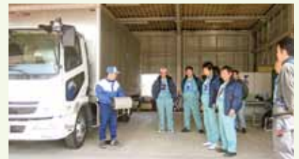
日常車両点検実習:車両の燃費性能を維持するために日頃からの車両整備は重要