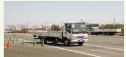
走行実技:平素の自分の運転と、安全・エコドライブの違いに気付くことができる