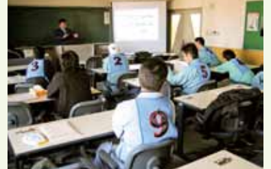
安全運転と漫然運転の違いを講義で確認

エコドライブ研修では、単に運転テクニックを磨くのではなく、「安全やエコドライブに対する意識」について実体験を通して認識してもらいたいと思っています。①いざという時にどうなるのか？ ②安全意識の高い運転とはどのような運転か？ ③エコドライブを効率よく行うには、どうすればいいのかを学び、さらに、その理想の運転と、ご自身の日常運転における安全意識、運転テクニックとのギャップを体感していただきます。