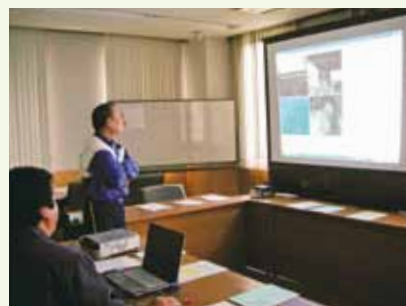
SRの映像やデータを見ながらドライバーの安全意識について検証を行う

また、元警察官である知識を活かし、事故捜査の基本から受講者の運転癖を映像から読み取り、「こう運転をすれば、事故にならなかった」という適切なアドバイスを行います。ドライバーは、「違反・事故者：無事故者=2：8」の割合に大別できます。約2割の未熟なドライバーの運転傾向を理解した上で、受講者自らが安全運転への意識について考え直すことが求められます。