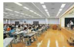
運行管理者資格試験準備特別講座