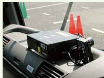
研修車両のダッシュボードにSRが設置されています

「点数をいかに上げるか」とテクニックにこだわる受講者もいますが、そのためにはSRと仲良くすることが必要です。しかし、SRのことを知らないと仲良くできないし、結局は日頃の自分の運転について知り、慎重な運転に変えることが必要になるのです。