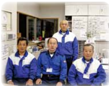
取材にご協力いただいた皆様

また、現在、本研修センターではコース拡大工事を行っております。研修の更なる充実を図ってまいります。