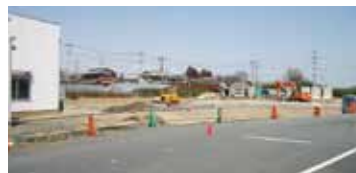
現在拡大中の研修コース