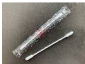
サンハヤト 接点復活剤付綿棒 PJR-CS150